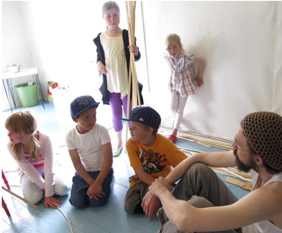
Diskussion och planering inför arbetet. Utgångspunkten var att med träpinnar bygga från golv upp till tak i utställningsrummet.