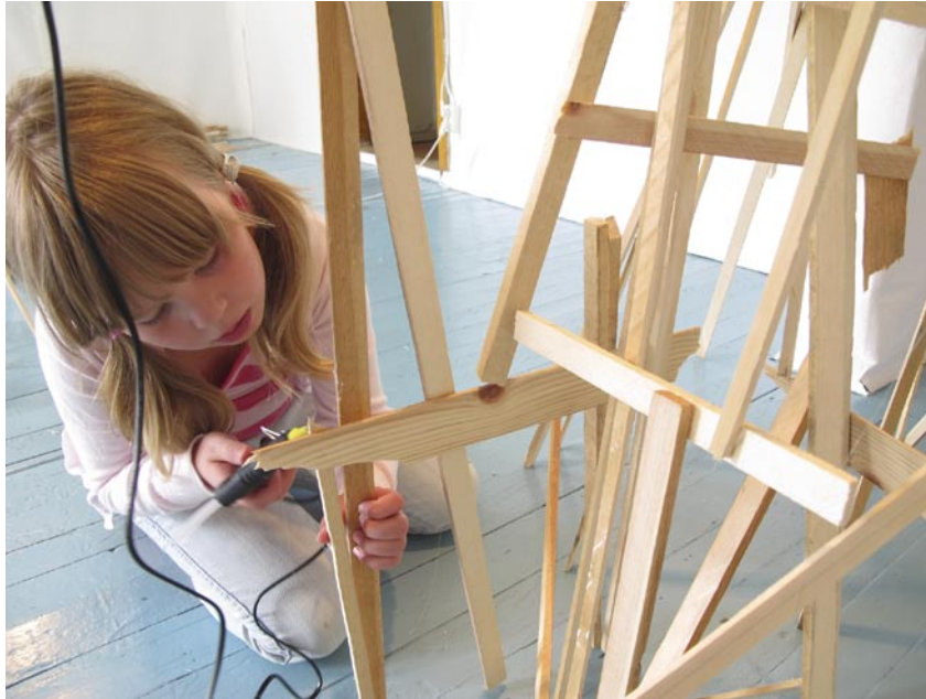
Limpistolen är praktisk och fungerar bra i arbetet med att nå taket.